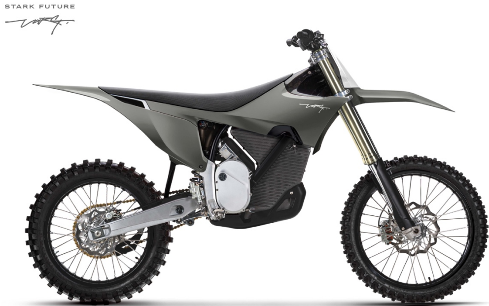
Abbildung 2: Stark VARG

Am 14. Dezember 2021 kündigte das Unternehmen Stark Future ein neues Motocross-Motorrad an: Die Stark VARG. 106 Was die Maschine von den aktuell konkurrenzfähigen Motorrädern dieses Segments unterscheidet, ist vor allem ein elektrischer Antrieb, der den im Sport vorherrschenden Verbrennungsmotor in dieser Konstruktion gänzlich ersetzt. Bislang konnte kein elektrisch angetriebenes Motorrad in Wettbewerben des Profisports Fuß fassen. Nach Herstellerangaben dürfte die Stark VARG jedoch voll konkurrenzfähig oder den Verbrennern sogar überlegen sein.