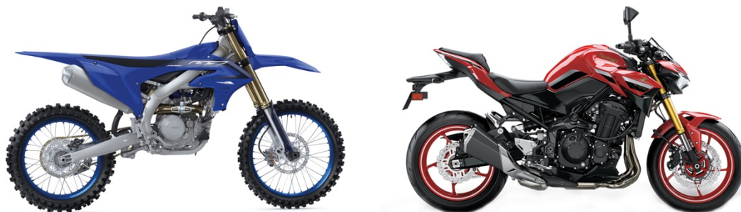
Abbildung 1: Yamaha YZ450F 2023 und Kawasaki Z900 2022

Die Yamaha YZ450F repräsentiert in der obigen Abbildung 1 die Motocrossmaschinen, während die Kawasaki Z900 stellvertretend für übliche Straßenmotorräder steht. Die Wahl fiel beim motocrossspezifischen Motorrad auf diese Maschine, da das Vorgängermodell aus dem Baujahr 2022 in mehreren Vergleichstests als Sieger 90 beziehungsweise Favorit für die breite Masse 91 hervorging, wodurch dem ausgewählten Yamaha-Modell eine technische Konkurrenzfähigkeit unterstellt werden kann. Die Kawasaki Z900 wiederum ist für 2021 als in Deutschland am häufigsten neuzugelassenes Motorrad gelistet, welches als reines Straßenmotorrad keinerlei Ansprüche auf Tauglichkeit für Fahrten im Gelände hegt. 92 Anhand dieser beiden Motorräder soll das folgende Kapitel die wichtigsten Besonderheiten der Motocrossmaschinen in Abgrenzung zu anderen Motorrädern erklären.